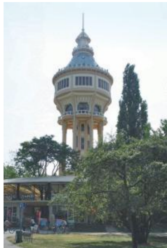
BOVEN De Donau verdeelt de stad in Boeda en Pest RECHTS De watertoren op het Margit- eiland

inborst. Deze komt duidelijker dan ooit naar voren tijdens de tientallen festivals die Boedapest jaarlijks heeft. Het bekendst is het muziekfestival Sziget dat elk jaar in de zomer wordt gevierd. Maandelijks kunnen toeristen op een laagdrempelige manier kennismaken met jonge Hongaarse kunstenaars en ontwerpers tijdens WAMP. En in september trekken traditionele en nieuwe wijnhuizen naar de hoofdstad voor het wijnfestival. Maar wanneer je ook naar Boedapest reist: er is altijd wel een festival waar je je kunt onderdompelen in de Hongaarse cultuur en de lokale bevolking wat beter leert kennen.